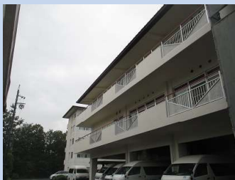
地域：愛知県豊田市野見山町 5 丁目 施工名：恩賜財団老健「とよた苑」様外壁東・南面光触媒施工。 日時：平成 27 年 9 月 10 日