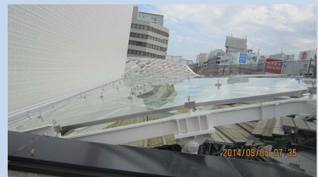
地域：岡山市下石井 1 丁目 施工名：イオンモール岡山キャノピーに光触媒施工。 日時：平成 26 年 08 月 12 日