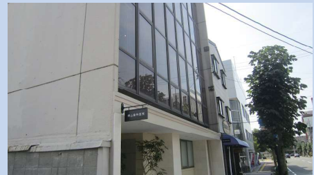
地域：岐阜市司町 施工名：桐山歯科医院様診察室ガラス 遮熱施工。 日時：平成 27 年 8 月 12 日