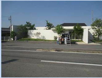
地域：愛知県安城市篠目 6 丁目 施工名：後藤歯科医院様 害虫忌避剤施工。 日時：平成 27 年 5 月 10 日