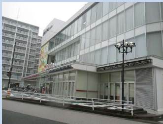
地域：岐阜県多治見市本町 3 丁目 施工名：スーパーヤマナカフェ館多治見店様防カビ対策で光触媒施工。 日時：平成 27 年 9 月 17 日