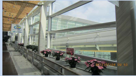
地域：愛知県常滑市 施工名：中部国際空港国際線・国内線通路外部光触媒施工 日時：平成 24 年 7 月 4・5 日